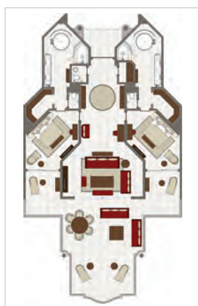
Suite Crystal Rock, Suite Coin de Mire, Suite îlot Gabriel