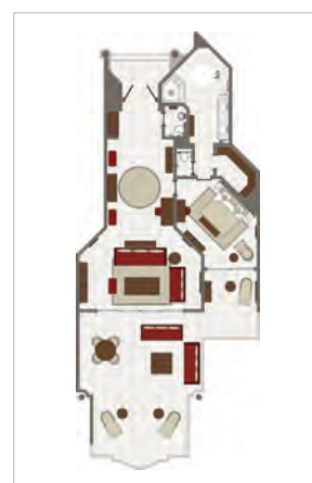
Suite île D'Ambre