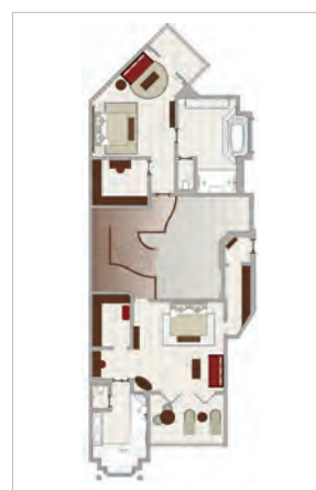
Suite Royale (à l'étage)