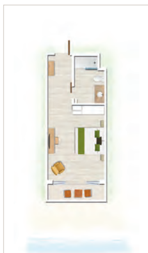
Chambre Standard / Chambre Standard Front de mer