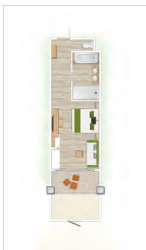
Chambre Supérieure / Chambre Supérieure Front de mer