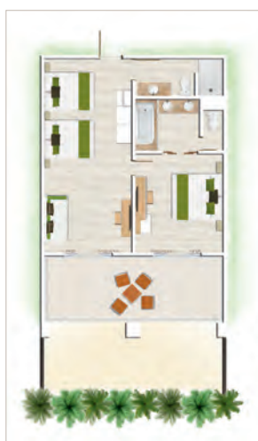
Appartement Famille de 2 chambres