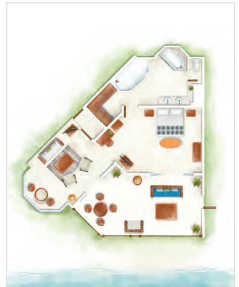
Suite Senior Front de Mer / Suite Senior Zen Front de Mer