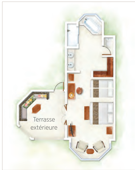
Suite Junior (2 adultes + 2 enfants) / Suite Junior Front de Mer (2 adultes + 2 enfants) / Suite Zen / Suite Zen Front de Mer