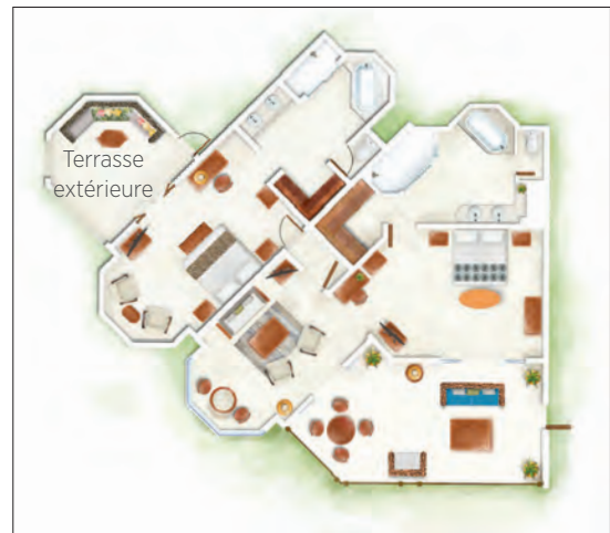
Suite Famille Senior Front de Mer - 2 chambres