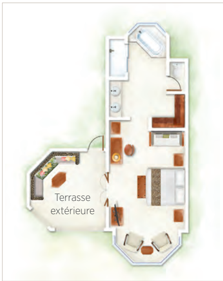
Suite Junior / Suite Junior Front de Mer / Suite Zen / Suite Zen Front de Mer